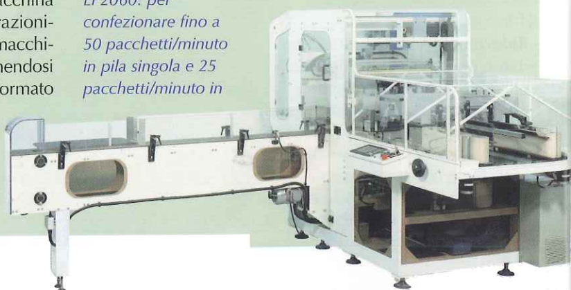
EP2060: per confezionare fino a 50 pacchetti/minuto in pila singola e 25 pacchetti/minuto in

A completare la gamma: IAC40 imbustatrice-rotoli per pacchi di carta igienica con/senza maniglia e FT2420 fasciatore-log di asciugamani piegati.