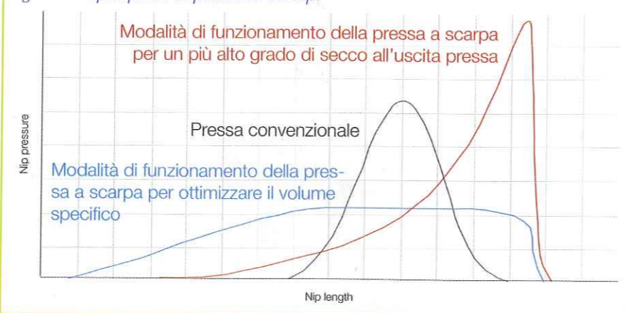
Figura 1 - Tipici profili di pressione del nip.

EVOLUZIONE, NON RIVOLUZIONE: ANDRITZ CONTINUA LO SVILUPPO DELLA SUA PRESSA A SCARPA PER RAGGIUNGERE UN LIVELLO PIÙ ALTO DI PERFORMANCE MIGLIORANDO NEL CONTEMPO LA QUALITÀ DELLA CARTA TISSUE. MENTRE LE PRESSE A SCARPA SONO STATE UTILIZZATE PER DECENNI NELLA FABBRICAZIONE DELLA CARTA TRADIZIONALE, IL LORO USO NELLA PRODUZIONE DEL TISSUE È INIZIATO ALLA FINE DEL 1990. DA ALLORA, ANDRITZ È STATO UNO DEI PIONIERI NELLA CREAZIONE DI PRODOTTI PER LE ESIGENZE DEL SETTORE TISSUE, COLLEZIONANDO UNA NOTEVOLE CONOSCENZA ED ESPERIENZA OPERATIVA.