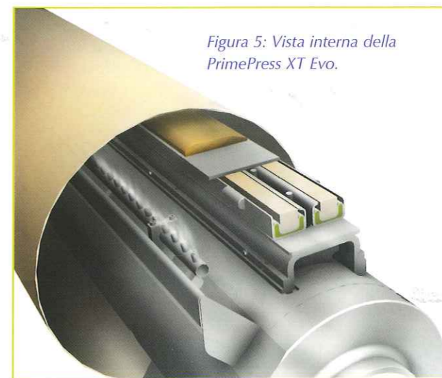
Figura 5: Vista interna della PrimePress XT Evo.

Poiché la scarpa è ampiamente supportata dai tubi